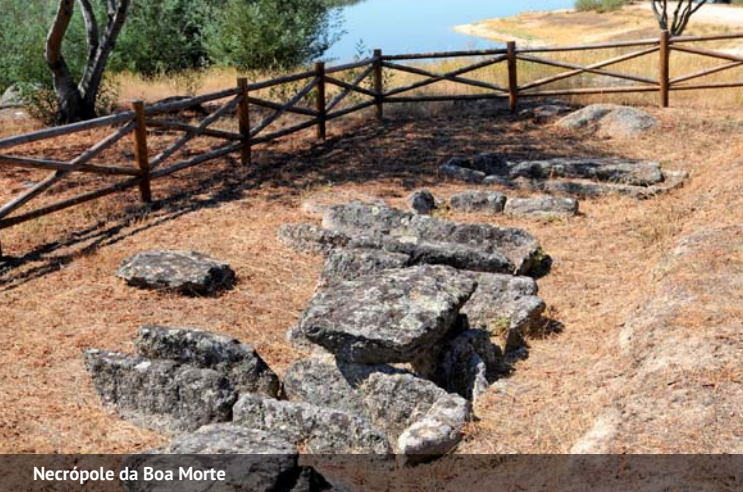
Necrópole da Boa Morte