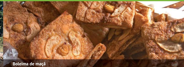
Boleima de maçã